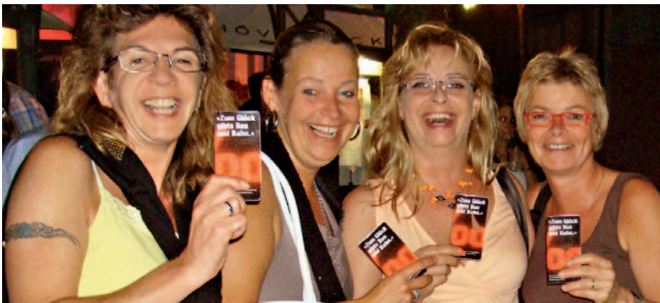
Les billets gratuits ont du succès auprès des participants à la Jazz Night de Zoug.

BILLETS GRATUITS Suite à l'introduction du 0,5 pour mille, les Transports publics du pays de Zoug ont commencé à distribuer des billets de bus gratuits aux noctambules une fois par année, sur mandat de la communauté tarifaire de Zoug. Cette opération doit inciter à prendre le bus et le train plutôt que la voiture. L'idée est reprise par un nombre croissant d'entreprises de transports publics.