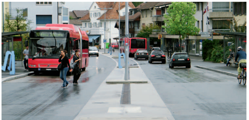
Un exemple réussi d'une chaussée partagée dans le centre de Köniz (BE).